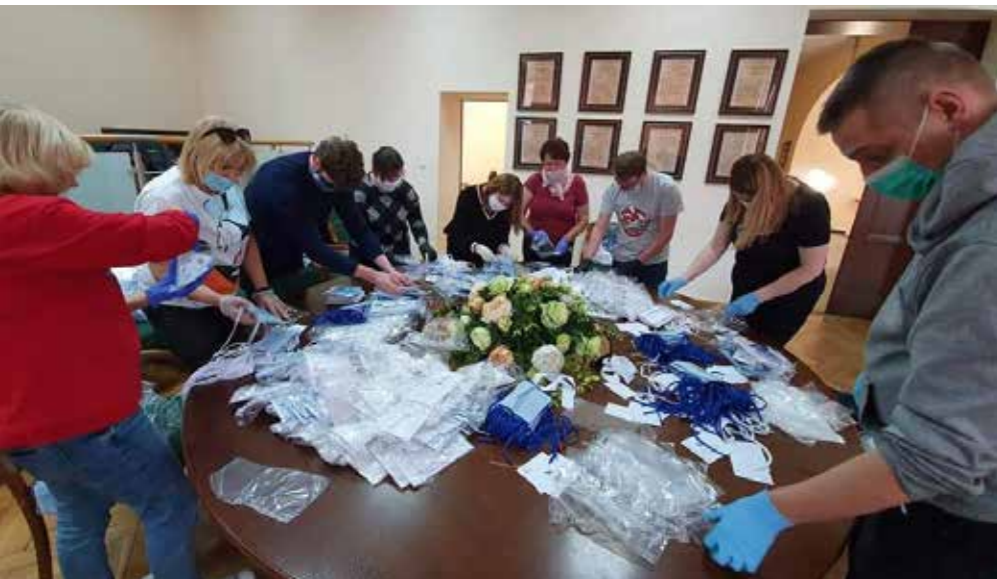
Paczki środków ochrony osobistej, przygotowywane przez pracowników Gminy Wołów trafiły do wszystkich seniorów.

Gmina Wołów prowadzi szereg działań i realizuje programy wspierające osoby starsze. Jednym z kluczowych elementów działalności samorządu jest m.in. uchwalony program „Gmina Wołów Seniorom”.