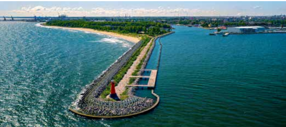
W ciągu ostatniej dekady w gdańskim porcie potrojono liczbę przeładunków

W trzech największych portach morskich trwają obecnie inwestycje o wartości około 10 mld złotych. Dzięki temu porty biją kolejne rekordy przeładunków, rośnie też ich znaczenie na Bałtyku i w Europie. Port Gdański na przykład w ubiegłym roku awansował do grona 20 największych portów na naszym kontynencie.