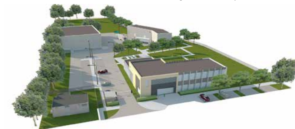
Wizualizacja Średzkiego Inkubatora Przedsiębiorczości w wersji docelowej