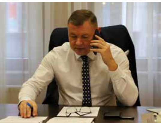
Roman Potocki - Starosta Powiatu Wrocławskiego