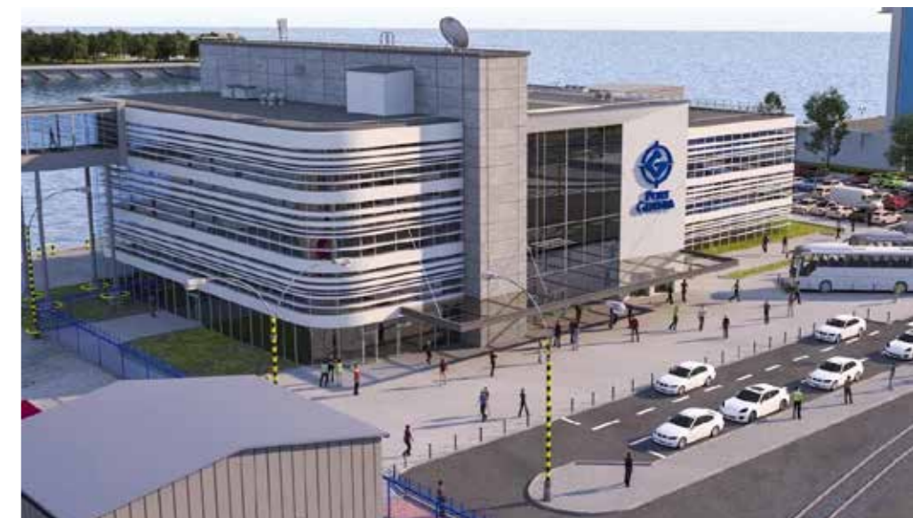
Publiczny Terminal Promowy

Do akcji dołączyło wiele firm z Trójmiasta. W ostatnim czasie pozyskano kolejnego partnera, Grupę LOTOS, dzięki czemu, w ramach przedłużających się panujących warunków, inicjatywa będzie kontynuowana w 2021r.