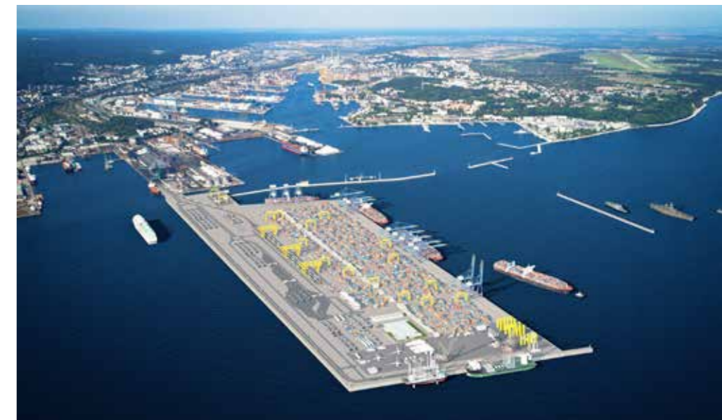
Port Zewnętrzny w Porcie Gdynia

Wielkimi krokami zbliża się zakończenie prac przy budowie Nowego Publicznego Terminalu Promowego w nowej, dogodniejszej lokalizacji. Nowy obiekt będzie mógł obsługiwać promy o długości 240 m i zapewni krótszy czas obsługi dzięki czemu port zyska nowych armatorów na rozwijającym się segmencie ro-ro. Budynek terminalu, magazyn oraz galeria pasażerska są już na ukończeniu, obecnie prowadzone są roboty wykończeniowe i instalacyjne wewnątrz. Zakończono roboty konstrukcyjne związane z przebudową Nabrzeża Polskiego oraz rampy Ro-Ro, do wykonania pozostał montaż wyposażenia – urządzenia odbojowe, cumownicze itp. Konstrukcja estakady najazdowej wraz z nawierzchniami bitumicznymi jest ukończona, prowadzony jest obecnie montaż wyposażenia, wykonywane są nawierzchnie betonowe. Roboty kolejowe zostały całkowicie ukończone, zaś nawierzchnie drogowe placów i parkingów wykonano w ok. 90%.